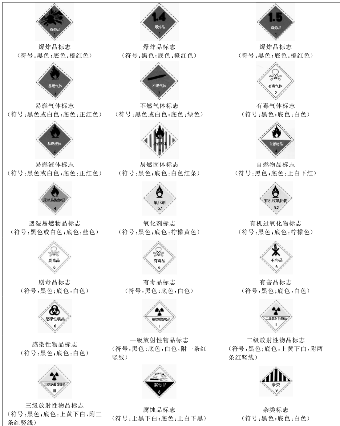
图 6-2 警告性标志

上述运输包装上的各类标志,都必须按有关规定标打在运输包装上的明显部位,标志的颜色要符合有关规定的要求,防止褪色、脱落,要使人一目了然,容易辨认。