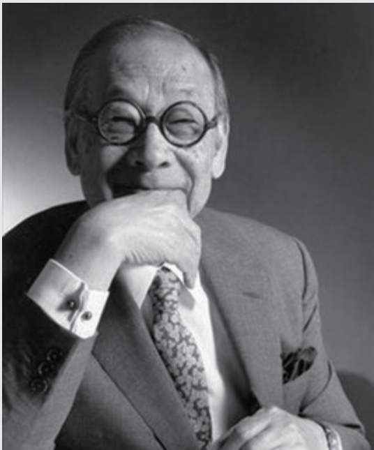
图 2-2 贝聿铭 / 美籍华人