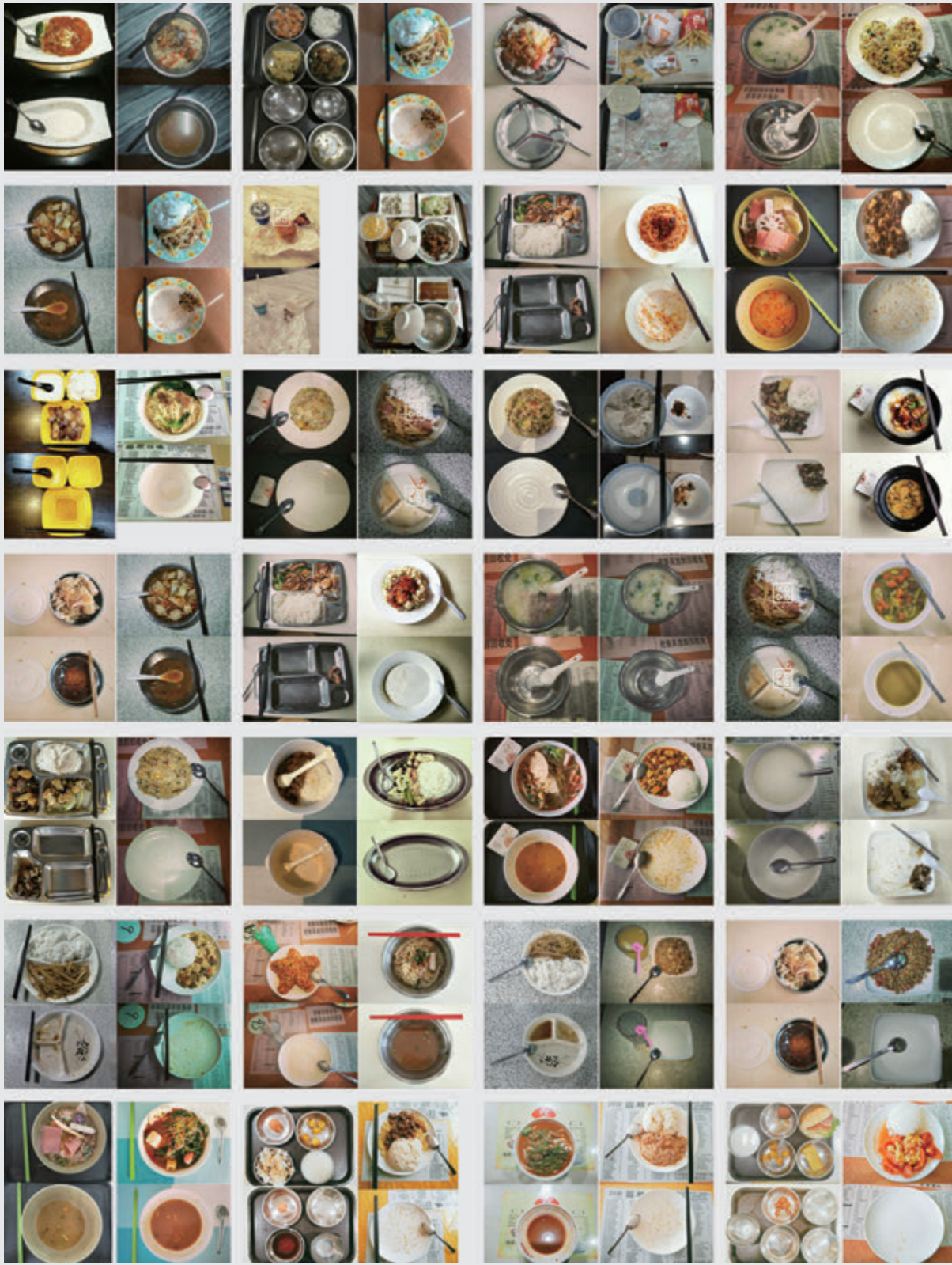
图 2-13 光盘行动 / 刘倩 / 中国 / 2016