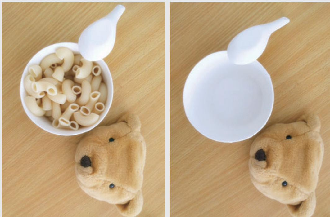
图 2-12 光盘行动 / 蔡凤英 / 中国 / 2016