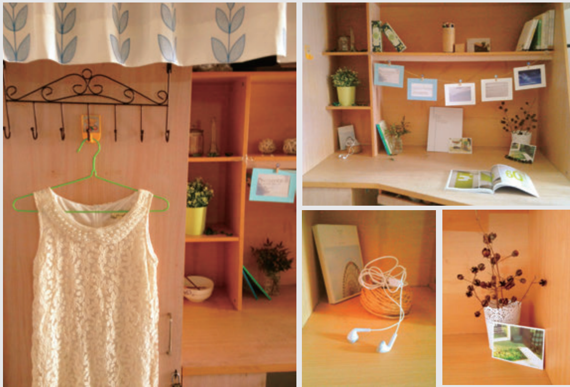
图 2-17 梦想“家” / 罗敏华 / 顺德职业技术学院 / 中国 / 2014