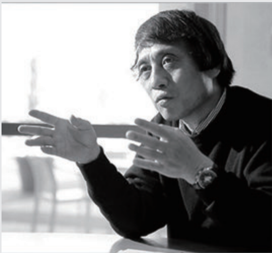
图 2-1 安藤忠雄 / 日本

什么样的人就会做什么样的事情，什么样的设计师就会设计出什么样的环境。环境艺术设计的优劣取决于设计师对生活的感悟及自我修养。因此，人文素养的提升是设计师进行设计的基础，人文素养的养成不在于我们一定要做惊天动地的大事，而在于我们在日常生活中点点滴滴的坚持与积累。