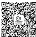
微课 安全教育的 范围

中职生作为一个特殊的社会群体，其生理和心理还不够成熟：一方面，学校必须加强对中职生安全知识的普及力度，帮助他们树立正确的社会和校园安全观；另一方面，中职生自身也应该主动掌握以下几个方面的安全知识。