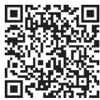
视频 劳动创造历史 线路图

马克思在《德意志意识形态》中指出：“我们首先应当确定一切人类生存的第一个前提，也就是一切历史的第一个前提，这个前提就是：人们为了能够‘创造历史’，必须能