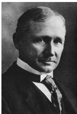
图 1-1 弗雷德里克·温斯洛·泰勒