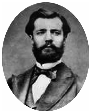
图 1-2 亨利·法约尔