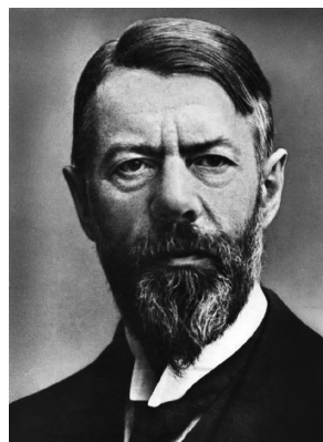
图 1-3 马克斯·韦伯

泰勒出生在美国费城,做过工人、领班、主任、总机械师、总工程师,长期工作在基层。他结合工人工作的实际,主要研究了提高劳动生产率和降低成本等方面的问题。他特别强调管理的特殊职能,极力主张将管理从具体工作中分离出来,认为必须有专人研究管理。泰勒开了科学管理的先河,在管理领域做了许多开拓性的工作,被后人誉为“科学管理之父”。他认为,管理就是确切地知道要让别人做什么,并使他用最好的方法去做,即指挥他人用最好的办法工作。