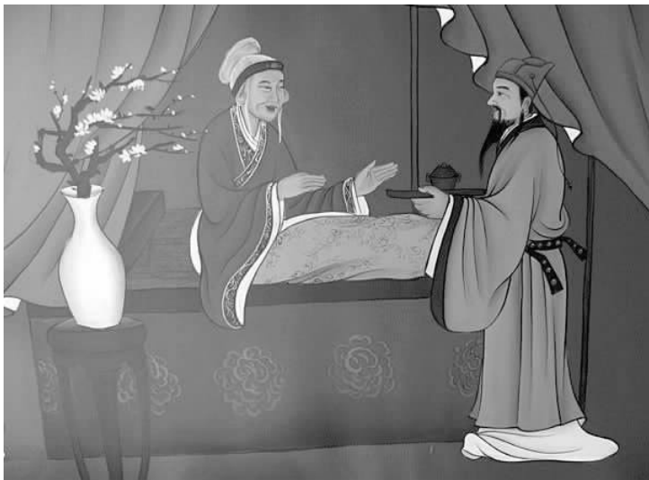
图 1-3 《弟子规画传》插图(王登科绘)

《吕氏春秋·孝行》中说:“夫孝,三皇五帝之本务。”孝悌之道成为古代道德的根本。“孝”的教育,主要是要求幼儿从小养成不违父母意志,服从父母绝对权威的习惯。《弟子规》中规定:“亲有疾,药先尝,昼夜侍,不离床。”(图 1-3)北宋史学家司马光在《居家杂仪》中也指出:“凡诸卑幼,事无大小,毋得专行。必咨禀于家长。”这些均突出了父母的绝对权威。对幼儿进行“孝”的教育,还要求幼儿自小养成敬奉双亲的习惯。《孝经·纪孝行章》中说:“孝子之事亲也,居则致其敬,养则致其乐。”