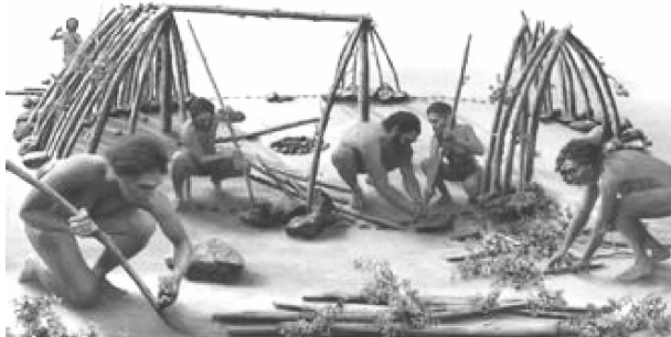
图 1-1 北京猿人教孩子制造石器(想象图)

原始社会对儿童实施公育,其教育内容均与儿童今后将要参加的集团内共同的生产与生活活动密切相关。长辈将简单劳动工具的制造、取火的技术、渔猎的经验、采集及农作物栽培的经验,以及原始手工业如捻麻线以制衣和造土、调土以制陶器等技术传授给后代,使他们从小就爱劳动、会劳动。例如,北京猿人教孩子制造石器,告诉孩子要选择坚硬的石料,敲击刃口、锥尖,使普通的大石块变成可以袭击野兽的尖锐锋利的石器(见图 1-1)。大人还教孩子用火,给孩子讲解火的用处、如何取火和保存火种的方法。现代民族学也证明了这一点,如对我国少数民族鄂温克族人(中华人民共和国成立前仍处于父系氏族社会)和基诺族人(中华人民共和国成立前尚处于原始社会农村公社阶段)的调查便体现了这一特点。