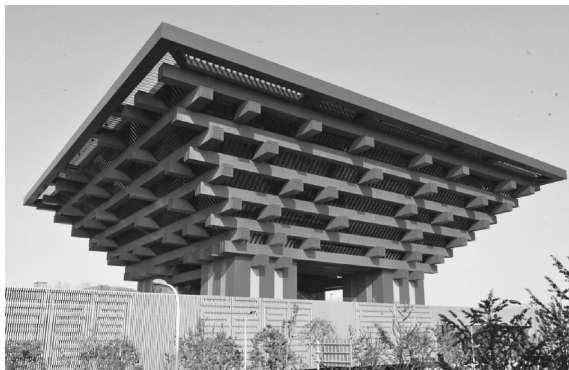
图 0-14 上海世博会中国国家馆

由于建筑首先是一种物质资料的生产,因此,建筑形象就不能离开建筑的功能要求和建筑技术而任意创造,否则就会步入形式主义、唯美主义的歧途。