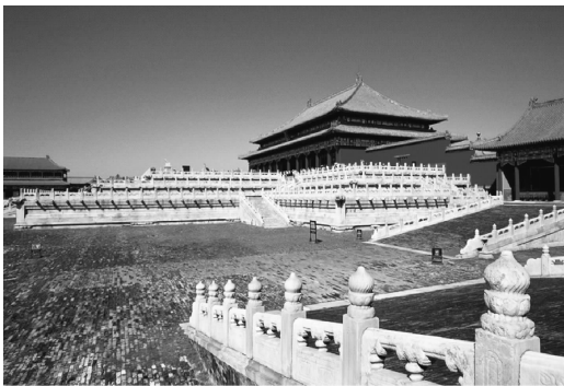
图 0-4 故宫

宫(见图 0-4),清代的圆明园、颐和园、避暑山庄、天坛等优秀的建筑。不过,到了清末,中国传统建筑终因不能适应现代工业生产和生活的需要,不能满足国人求新求奇的精神需求,而逐步被西方的舶来品所替代。