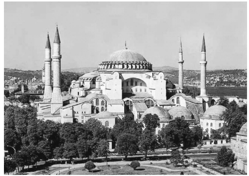
图 0-8 土耳其索菲亚大教堂