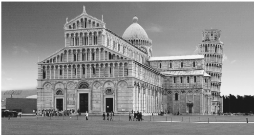
图 0-9 意大利比萨大教堂和斜塔