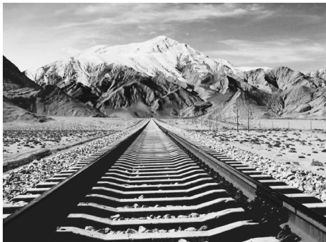
图 0-6 青藏铁路

随着人类环保意识的不断增强,无毒、无公害的绿色建材将得到日益推广,人类将用更新、更好的建筑材料营造自己的绿色家园。例如,我国正在研制和开发一些绿色建材,并在设计和建造中充分考虑减少污染的问题。我国的青藏铁路(见图 0-6)建设就是充分考虑减少污染的典范。