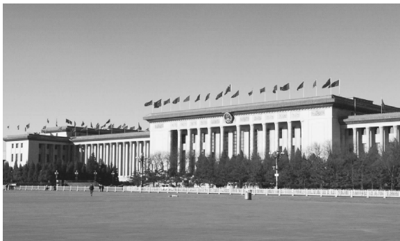
图 0-12 人民大会堂