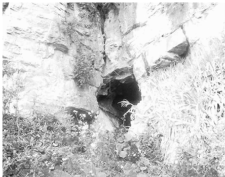
图 0-1 崖洞图

的造型艺术。早在 50 万年前的旧石器时代,中国原始人就已经知道利用天然的洞穴作为栖身之所,在我国的北京、辽宁、贵州、广东、湖北、浙江等地均发现有原始人居住过的崖洞,如图 0-1 所示。到了新石器时代,黄河中游的氏族部落利用黄土层作为墙壁,用木构架、草泥建造半穴居所,如图 0-2 所示,后来发展为地面上的建筑,并形成部落。仰韶、龙山、河姆渡等文化创造的木骨泥墙、木结构榫卯、地面式建筑、干阑式建筑等建筑技术和样式,为后来的建筑体系打下了基础。夏代和商代是这个体系的萌芽期,这两代不仅出现了壁垒森严的城市和建于夯土台上的大殿,而且出现了中国传统建筑基本空间的构成要素——廊院。