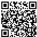
图文 中国当代十大 建筑

了人文关怀。又如,设置电动门通过感应可以自动开闭;电动窗遇下雨、偷窃、室内无人时,也可自动关闭,免去人们的担心。另外,使用声控灯、感应水龙头等,使房屋建筑更符合人们生活的需要等。