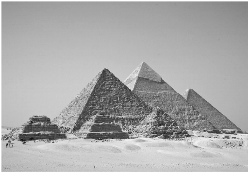
图 0-7 埃及金字塔