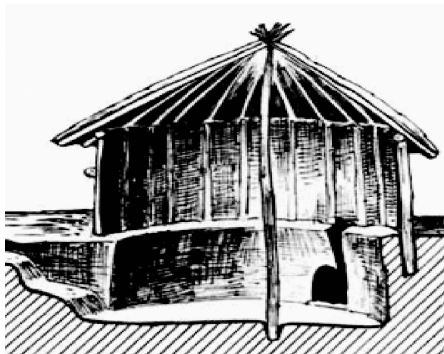
图 0-2 原始半穴居所

到了周代和春秋战国时期,中国古代建筑体系已初步形成。此后历代宫殿、坛庙、住宅、方格网城市等建筑群体的布局原则基本遵守周代建筑布局的对称严谨。这一时期的建筑还追求高大、华丽和宏伟,因而瓦、砖、斗拱、高台建筑也相应出现。