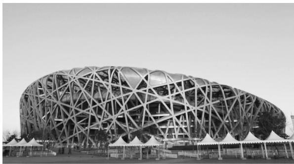
图 0-5 北京奥运会场馆——鸟巢

随着土地资源的日益紧缺和新结构、新材料、新方法的不断涌现,建筑工程正向高层、超高层、大跨度、大空间的方向发展。例如,近几年,我国的很多城市不仅建造了不少标志性的超高建筑,而且建造了一些大型公共建筑,如北京 2008 年奥运会场馆——鸟巢(见图 0-5),堪称钢结构大跨度建筑的世界之最。