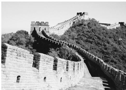
图 0-3 万里长城

秦代和汉代是中国建筑艺术发展的第一个高峰。两代建筑体制宏伟、博大雄浑,如阿房宫、秦始皇陵、万里长城(见图 0-3)等。经过魏晋南北朝的过渡,隋唐两代开始对外来文化进一步兼收并蓄。到 7 世纪中晚期至 8 世纪中期的盛唐,中国建筑艺术的发展达到了顶峰。至于晚唐、五代和宋、辽、金、元的建筑,则上续盛唐之余脉,下启不同之风格。其中,尤以宋代建筑最为杰出,它以自己的“醇和秀美”逐步替代了唐代建筑的“雄健深沉”。