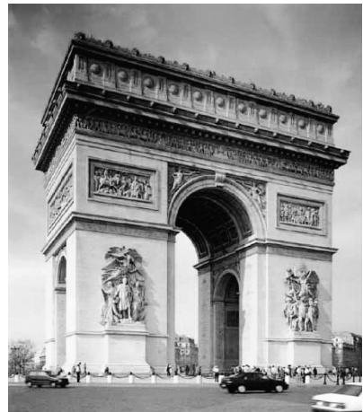
图 0-10 法国巴黎爱德华凯旋门