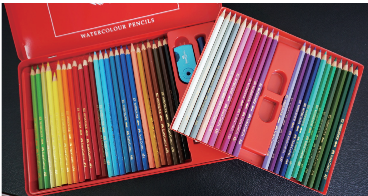
图 1-4 套系彩色铅笔

油画棒是一种油性彩色绘画工具，一般为长 10 厘米左右的圆柱形或棱柱形。油画棒的外表与蜡笔相似，但其纸面附着力、覆盖力更强，能展现油画般的效果。与蜡笔相比，油画棒的颜色更鲜艳，纸面附着力、覆盖力更强，如图 1-5 和图 1-6 所示。