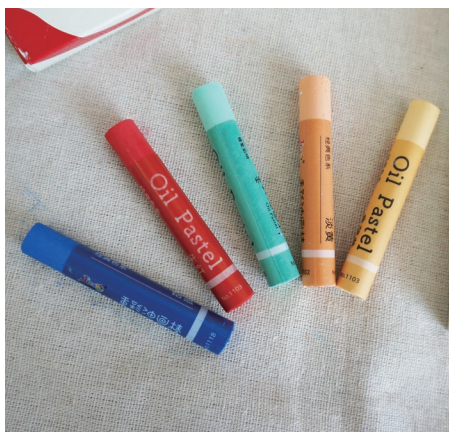
图 1-6 单支油画棒