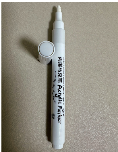
图 1-8 高光笔