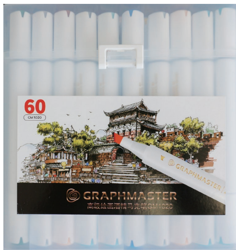
图 1-1 60 色套系双头马克笔

马克笔是一种可用于书写或绘画的彩色笔，其含有墨水，通常附有笔盖，笔盖上用数字标示色号，以方便选用，一般为双头，一头为小头，一头为大头，如图 1-1 至图 1-3 所示。