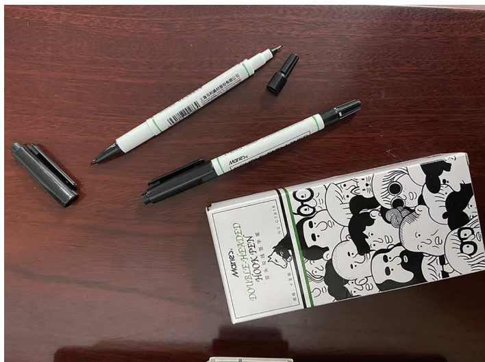
图 1-7 双头勾线笔

美术类高光笔也称为丙烯马克笔，它的覆盖力很强，是用于提高画面局部亮度的一种工具。例如，将其用于描绘水纹的高光部分，可使水纹生动、逼真。高光笔除了可用于美术绘画，还可用于玻璃、塑料、金属、木材、陶瓷等材料表面的记写和描绘。