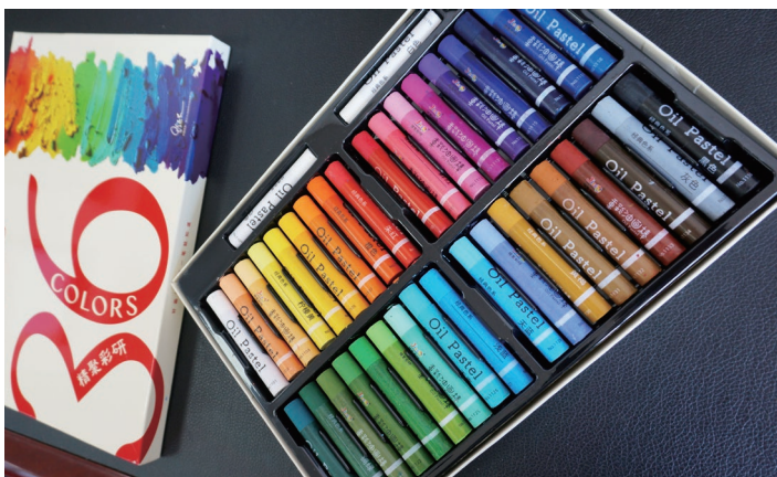
图 1-5 36 色油画棒