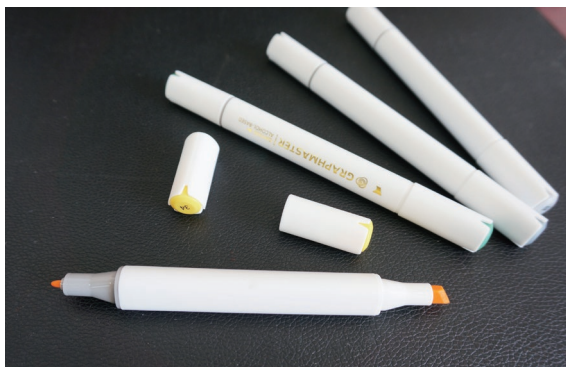
图 1-3 双头马克笔