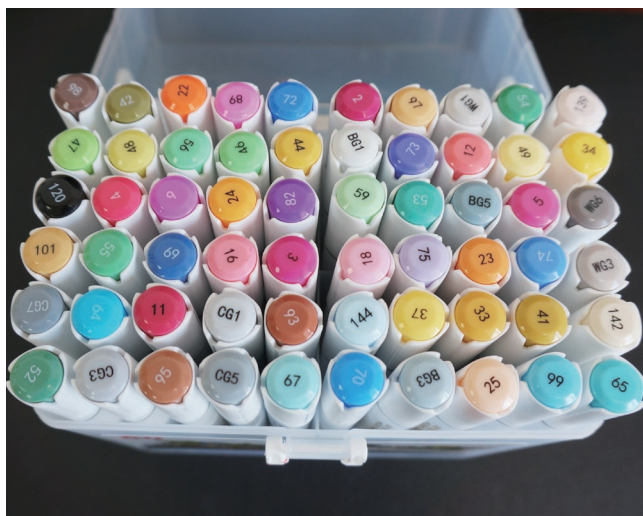
图 1-2 马克笔的色号